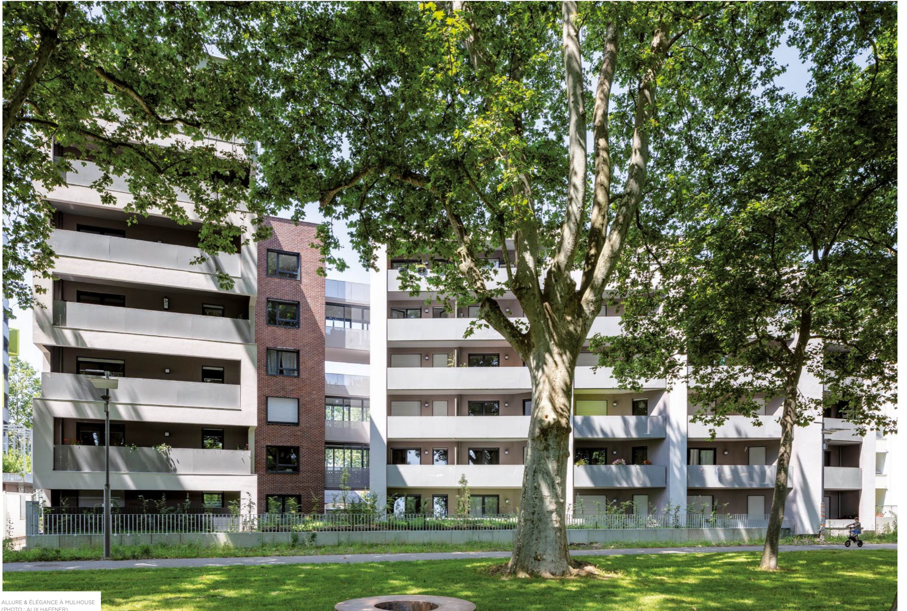
ALLURE & ÉLÉGANCE À MULHOUSE